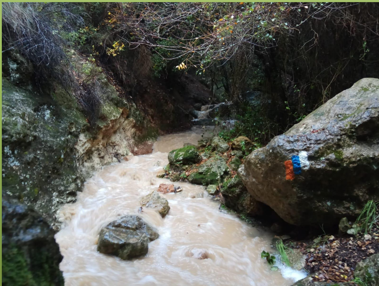
נחל חיק (נדב לוי)

3. היו ערוכים למסלול חליפי – תכנון מקדים נכון והכנת מסלול חלופי שלא מוגבל בגשם יאפשרו לכם לקיים את הטיול בבטחה גם במידה וישנם גורמים משפיעים בבוקר הטיול.